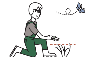
Im März definitiver Schnitt bis auf 4 Knospen.