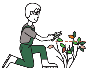
Im Herbst Triebe nur einkürzen.