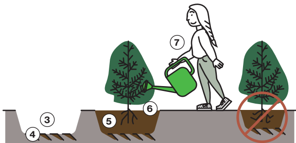
Falsch: Wurzeln zeigen nach oben. Pflanzgrube ist zu klein.